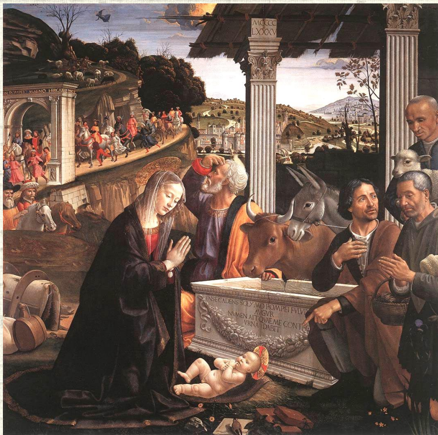
Domenico Ghirlandaio (1449-1494), Adorazione dei pastori